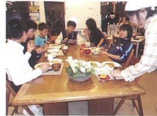
子どもの食堂つき