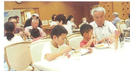
地域食堂ともいき