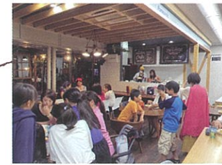
子どもの食堂 芽ぶき

2019年9月よりユーカリが丘・志津地区でオープンしました。さくら住建さんの素敵なスペースをお借りして開催します! どなたでもどうぞ☆ <住所> 佐倉市上志津1790-1 SAKULOUNGE レンタルスペース <電話番号> 043-489-8341(松本) <開催日時> 11/22開催、以降の日程はブログをご覧ください 17時~19時 <参加費> 大人¥500 子ども¥300 <URL> https://ameblo.jp/mebuki-sakurashi